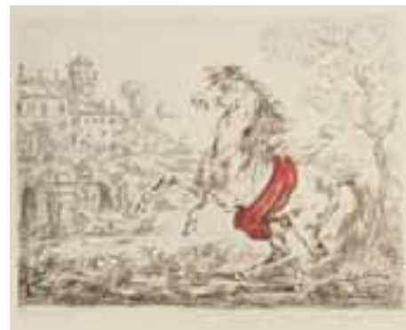
Cavallo e castello litografia a 3 colori 1954 59,5x49 cm