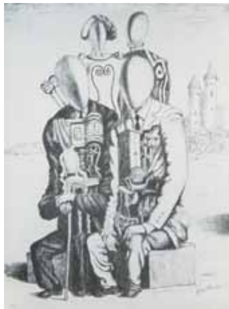
I nobili ed i borghesi litografia 1969 78x106 cm