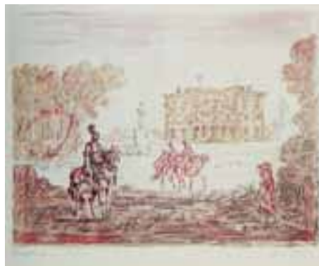
Cavalieri antichi litografia a 5 colori 1954 59,5x49 cm