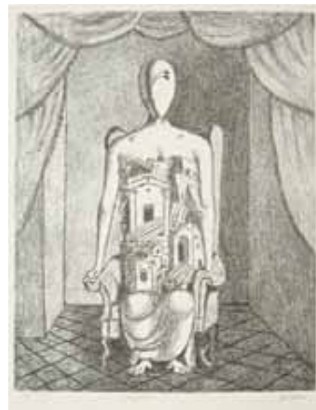
Il pensatore litografia 1969 51x67 cm esemplare colorato a mano