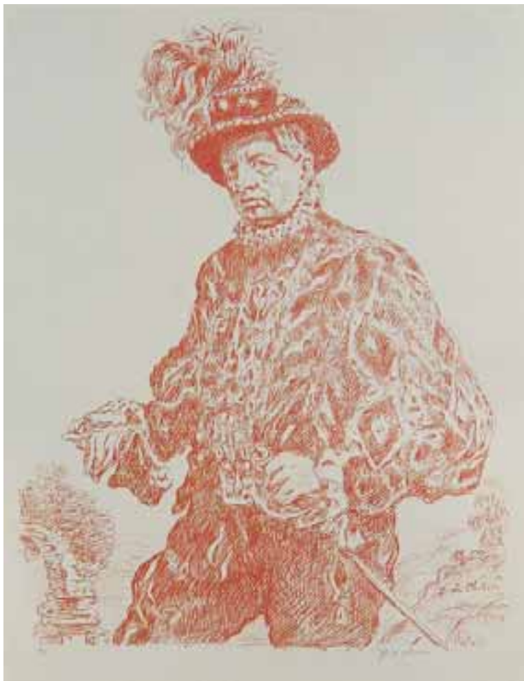
Autoritratto in costume litografia 1953 54x70 cm