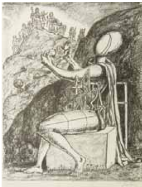
Giove "Presentazione del figlio agli dei" o "Offerta a Giove" litografia 1969 50x72 cm