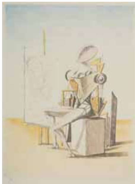
Il pittore litografia a 5 colori 1973 49,6x70 cm