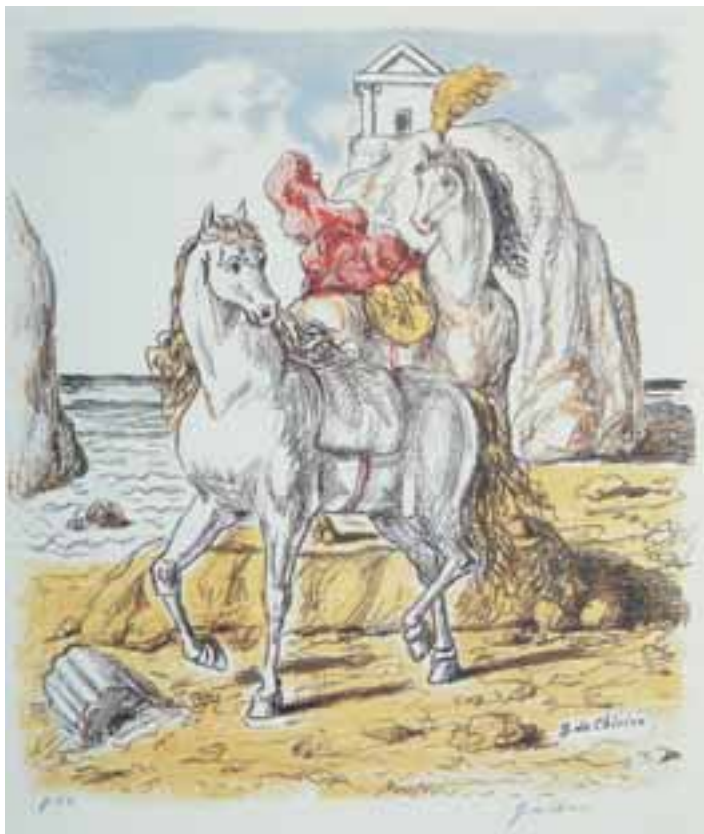
Cavalli su una spiaggia antica litografia a 8 colori 1969 51x71 cm