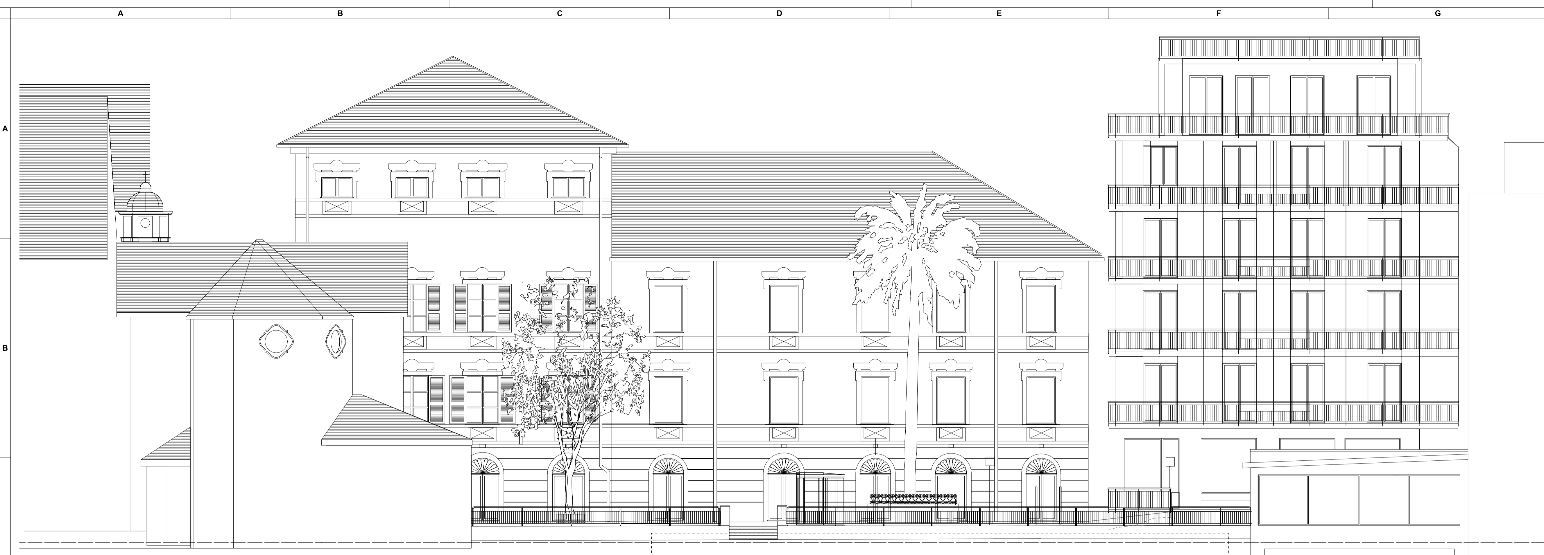
1 sezione BB scala 1: 100